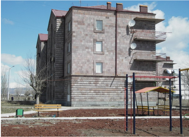
Գյումրի քաղաքի Երևանյան 109ա բազմաբնակարան շենքը

2. Երևանյան խճուղի 157ա շենքում, որի կենտրոնացված ջեռուցումն իրականացվում է շենքի տանիքում կառուցված կաթսայատնից: