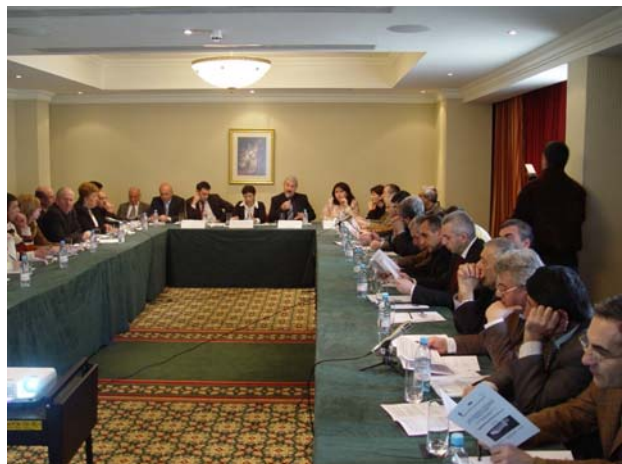
Ջեռուցման համակարգերի հաշվարկի հա-