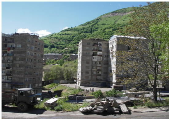
Բազմաբնակարան շենքեր Քաջարանում