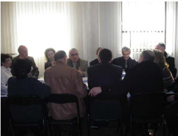
Վարձակալված կաթսայատների վերագործարկման աշխատանքների ընթացքի քննարկում խորհրդատվական կենտրոնում