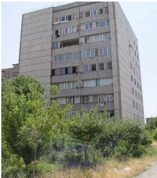
Բազմաբնակարան շենք Դավիթաշենում