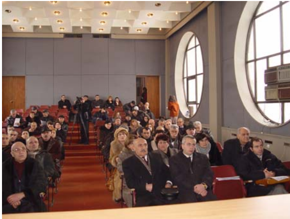
Շահառուների հավաք Միջազգային բիզնես-կենտրոնի դահլիճում

Բազմաբնակարան շենքերի կառավարման մարմինների գործունեության կոմունալ ծառայությունների մատուցման բարելավման (մասնավորապես ջեռուցման), ինստիտուցիոնալ, օրենսդրական և հարկային դաշտերի վերաբերյալ խորհրդատվական ծառայություններ են մատուցվել թվով 122 շահառուների, այդ թվում.