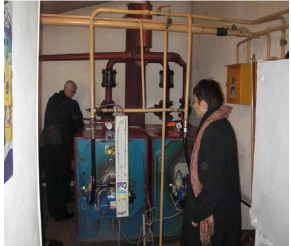
Գյումրի քաղաքի Երևանյան 157ա բազմաբնակարան շենքի կաթսայատունը