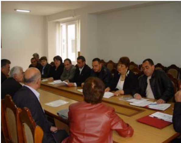
Հավաք Ավանի քաղապետարանում