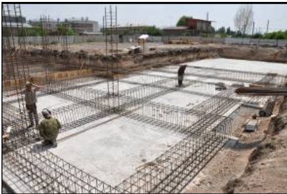
Строительство пилотного дома начато в августе 2011 года