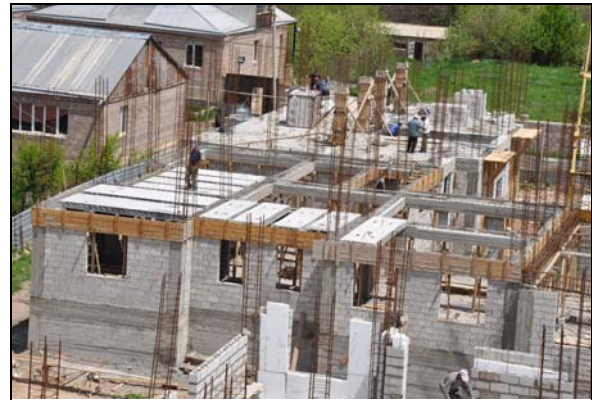
Пилотный дом, май 2012г.

Разница между сметной стоимостью базового и доработанного вариантов проекта – дополнительные расходы на мероприятия по повышению энергоэффективности, которые составляют 6% от базовой стоимости проекта. Предполагается повышение показателей энергоэффективности дома на 60%.