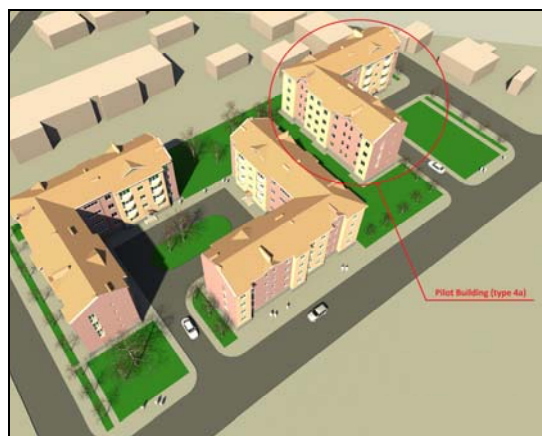
Квартал жилых домов в Ахуряне

В целях осуществления Проектом деятельности в направлении повышения энергоэффективности пилотного дома 30 июня 2011г. было подписано Письмо о намерениях между Министерством градостроительства РА, ЗАО «Глендел Хилз» (застройщик) и Программой развития ООН.