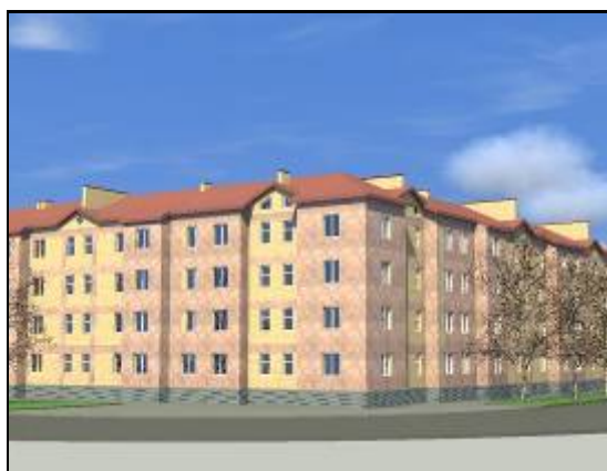
Модель пилотного дома

Строительство выбранного многоквартирного дома осуществляется по доработанному варианту базового проекта (дом типа N 4a квартала «Муш-2» города Гюмри).